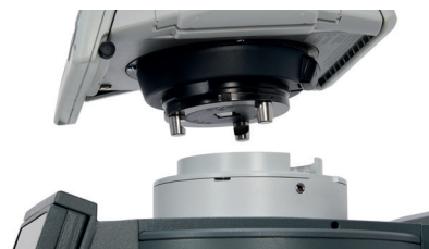
Modell mit abnehmbarer Totalstation